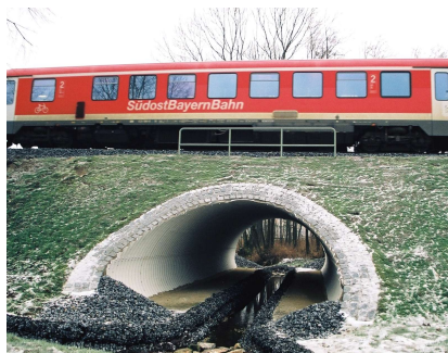
Bild 5: Durchlassbauwerk mit beidseitigem Laufsteg für Amphibien, Kleintiere, u.ä.

Das innovative Wellstahlprodukt zeigt auch bei diesem Einsatzgebiet einmal mehr, welches Potential sowohl wirtschaftlich als auch technisch in ihm steckt.