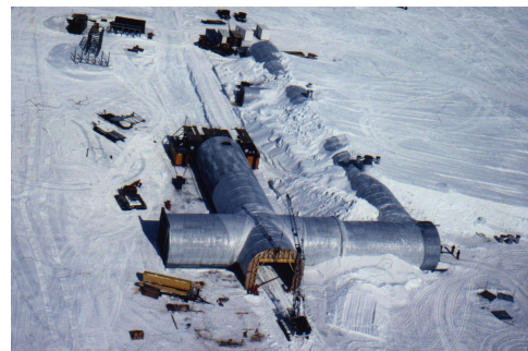
Bild 2: zweite Antarktis-Forschungsstation (mehrmaliges Kreuzen der Kreisprofile mit einer Spannweite von jeweils 8,00 m)