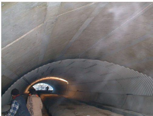
Bild 3: Einziehen des Hamco-Wellstahlbauwerkes in das zu sanierende Polygon-Betonbauwerk ohne Beeinträchtigung des Autobahnverkehrs

Exemplarisch zeigt das Projekt „Instandsetzung der Brücke über den Zarnowbach BAB A19“ einmal mehr die sehr gute Anpassung des Wellstahlprofils an den vorhandenen Brückenquerschnitt auch bei großen Stützweiten. Der Zwischenraum zwischen dem Wellstahlprofil und des Polygon-Betonbauwerkes ist so bemessen, dass einerseits die Querschnittsverkleinerung minimal und andererseits noch genügend Platz für das Einziehen des 68 m langen Korbbogenprofils (Spannweite 9,29 m, Höhe 2,99 m) gegeben ist.